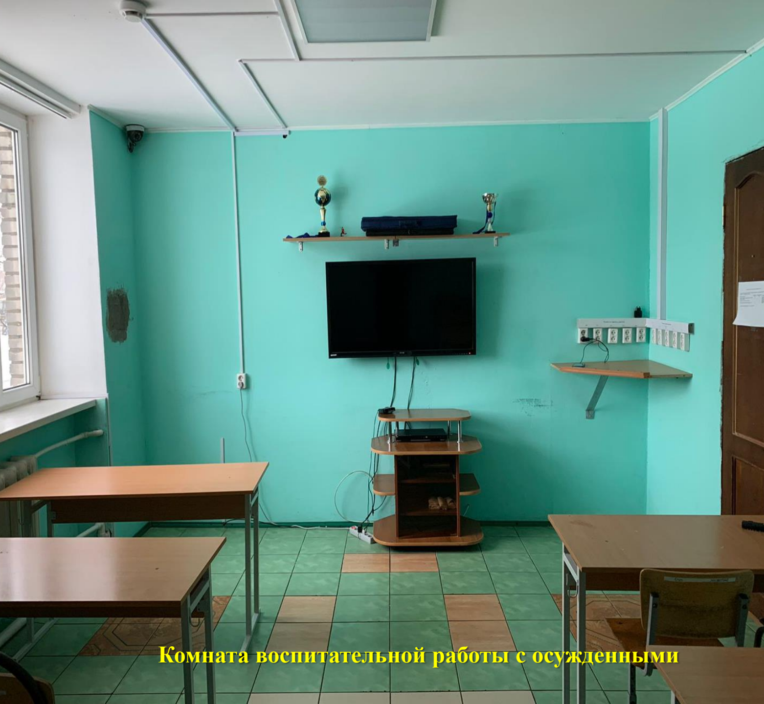
Комната воспитательной работы с осужденными