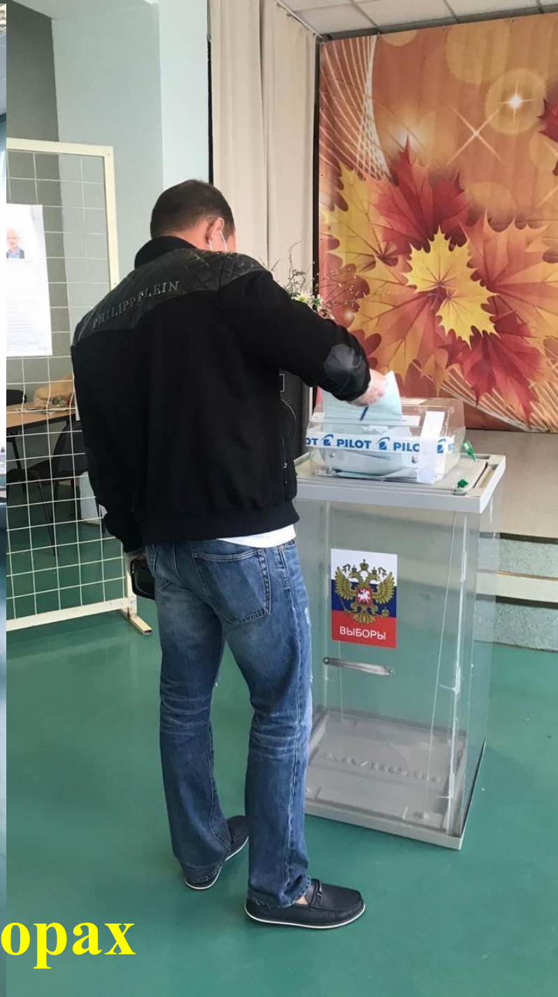
Участие осужденных в выборах